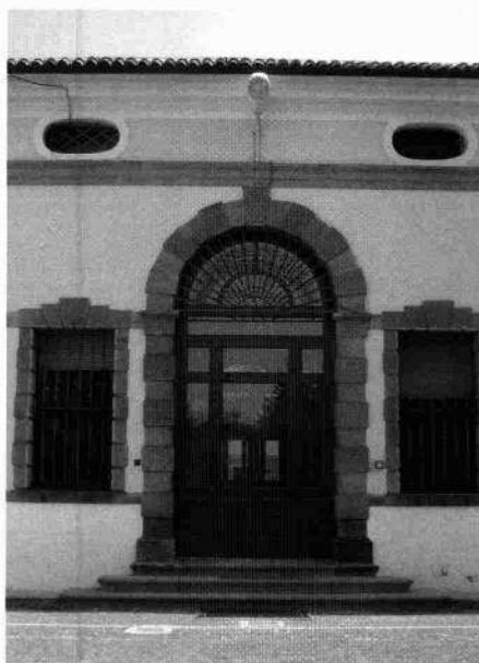
Prospetto verso la corte Esedra Particolare della nicchia con statua dell'esedra Il portale visto dalla corte interna